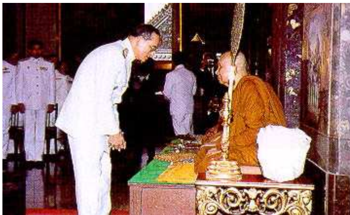
สมเด็จพระญาณสังวร สมเด็จพระสังฆราช-พระเจ้าอยู่หัว

เมื่อถึงห้าแล้ว หากจิตยังไม่สงบ ก็นับถอยหลังจากห้าลงมาหาหนึ่ง แล้วนับจากหนึ่งขึ้นไปหาห้าใหม่ กลับไปกลับมาเช่นนั้นจนกว่าจิตจะสงบ รับสั่งว่า ที่เห็นพระองค์ประทับอยู่นิ่งๆ นั้น พระจิตทรงอยู่กับหนึ่งเข้าหนึ่งออกตลอดเวลา